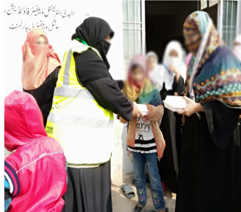
مستحقین میں کھانے کی تقسیم