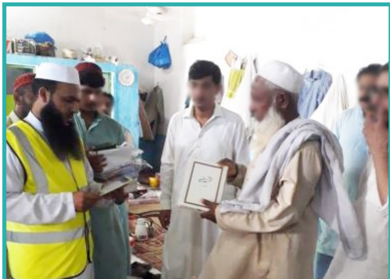
قیدیوں میں قرآن مجید کے نسخوں کی تقسیم

الہدیٰ خیبر پختونخواہ ریجن کی سوشل ویلفیئر ٹیم نے اپنے علاقے کی جیلوں اور قیدیوں کی فلاح و بہبود کے لیے ایک منصوبے کا آغاز کیا ہے۔ اس سال عید الاضحیٰ کے موقع پر جیلوں میں قربانی کا اہتمام کیا گیا اور روانتی پکوان پکوان کر قیدیوں میں کھانا تقسیم کیا گیا۔ نوشہرہ سنٹرل جیل کی انتظامیہ نے الہدیٰ کی بہترین کارکردگی کو دیکھتے ہوئے جیل میں لائبریری کے قیام کی اجازت دے دی۔ آپ سب کے تعاون سے سنٹرل جیل بنوں اور نوشہرہ جیل میں قرآن مجید اور دیگر دینی کتب کی لائبریریاں قائم کر دی گئی ہیں۔