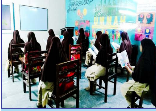
الہدیٰ کیونٹی سکول واہ کینٹ