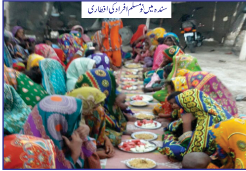
سندھ میں نو مسلم افراد کی افطاری

الہدیٰ نے گزشتہ سالوں کی طرح اس سال بھی ماہ رمضان سے قبل ہی ملک کے طول و عرض میں مستحقین کے لیے رمضان راشن فراہم کیا۔ بنیادی اشیاء پر مبنی تقریباً 9,198 پیکٹ، پنجاب، کشمیر، سندھ، خیبر پختونخواہ اور بلوچستان کے علاقوں میں تقسیم کیے گئے۔ راشن مہیا کرنے کے ساتھ ساتھ کراچی، لاہور، ملتان، رحیم یار خان، گوجرانولہ، واہ کینٹ، میرپور اور دیگر ریجنز کے تحت افطاری کے انتظامات بھی کیے گئے جن سے لوگوں کی کثیر تعداد نے فائدہ اٹھایا۔